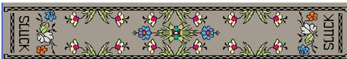
Рисунок 2 – Второй вариант «Закладки для книг» с использованием орнамента пояса слуцкого типа, изготовленного во второй половине 18 века

Структура разработанных изделий полностью соответствует своему мотиву. В строении участвуют две системы нитей основы и шесть систем нитей утка. На поверхности изделия присутствует 15 цветных и ткацких эффектов [5, 6].