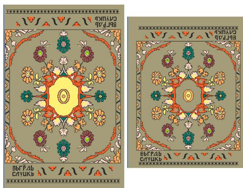
Рисунок 4 – Коврик под мышь случьего пояса «венково-медальонного» типа

Разработаны два варианта рисунков с одинаковыми композиционными схемами, рисунком, строением, но с разными размерами по высоте (рис. 4). Ширина изделий составляет половину ширины заправки ткацкого станка.