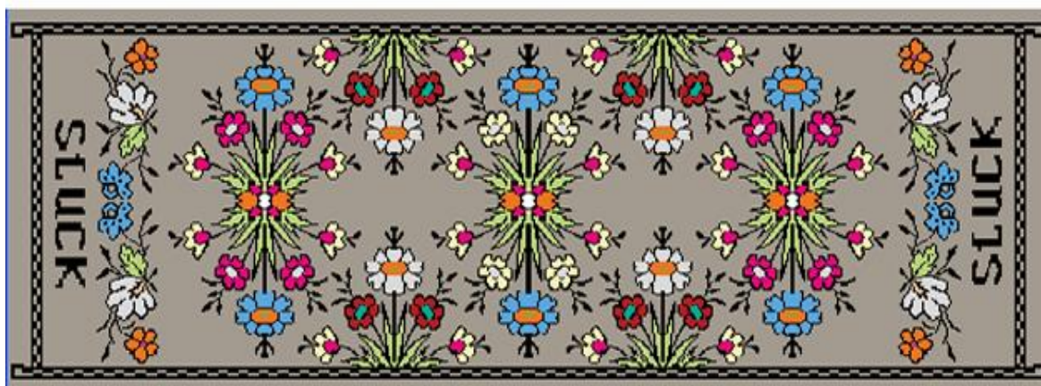
Рисунок 1 – Орнаментальные мотивы местной флоры в изделии «Закладка для книг»

Представленный образец имеет ширину 14 см. Второй вариант рисунка предполагает меньшую ширину – 5 см. При таком размере сохранить при воспроизведении в материале читабельность орнамента весьма сложно, если сохранять композиционную схему самого пояса. Поэтому ширина изделия обусловила решение ее внешнего облика. Рисунок характеризуется наличием большого числа мелких тонких элементов различного цвета (рис. 2).