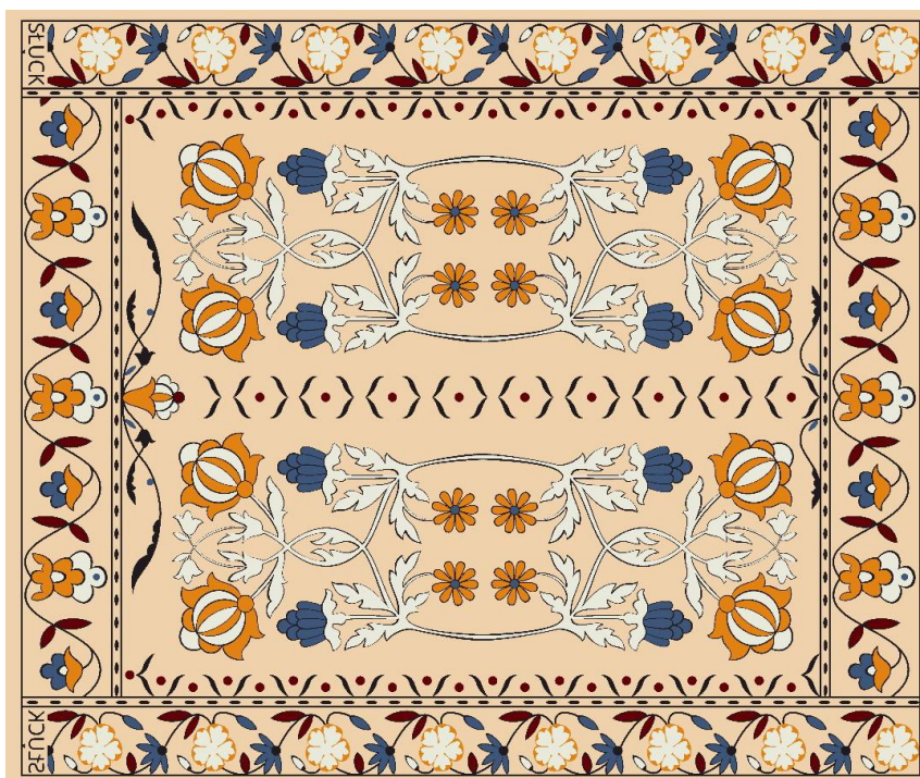
Рисунок 7 – Эскиз декоративного панно

дований национальной культуры, языка и литературы Национальной академии наук Беларуси. Среди экспонатов был представлен и слуцкий пояс, датируемый второй половиной XVIII века, найденный в костеле города Глубокое Витебской области. Он и послужил основным источником вдохновения для коллекции. Один из рисунков панно выполнен в материале и внедрен в производство (рис. 7).