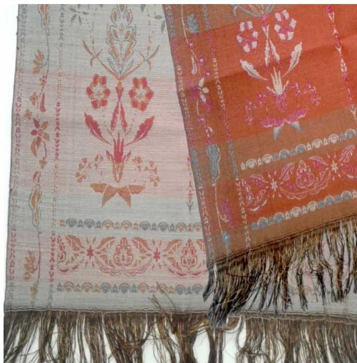
Рисунок 5 – Фрагмент шарфа, лицевая и изнаночная стороны

Представленное изделие имеет свое уникальное строение, базирующееся на наработках аналогов исторических поясов, однако имеющее свои характерные черты. По структуре спроектированное изделие – уточный гобелен. Назначение изделия подчеркнуто его строением, в котором принимают участие две системы основных нитей – прижимная и настилочная коричневого цвета и всего лишь три системы нитей утка, что придает большую легкость изделию и соответствует его функциональности. Участки шарфа с замененными утками имеют легкое отличие в оттенке, что придает шарфу небольшую ритмично-организованную полосатость, характерную для многих видов изделий данного типа.