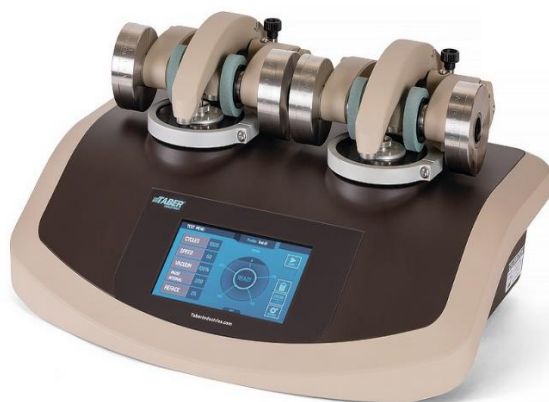
Рисунок 6 – Внешний вид ротационного абразиметра TABER

Для определения сопротивления истиранию использовался ротационный абразиметр TABER (рис. 6). Прибор для испытаний на стойкость к абразивному износу с вращающейся платформой TABER является надежным, точным испытательным инструментом для оценки сопротивления поверхностей истиранию.