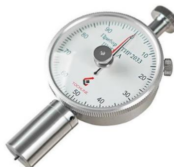
Рисунок 1 – Внешний вид твердомера 2033 ТИР

Для определения твердости использовался прибор переносной для измерения твердости резины по Шору А 2033 ТИР (твердомер). Принцип действия прибора основан на внедрении стального индентора в образец, из резины при полном контакте измерительной площадки с образцом. Перемещение индентора отсчитывается на шкале прибора. Чем выше твердость, тем меньше внедрение индентора в образец больше его перемещение и выше значение твердости. Внешний вид прибора для измерения твердости резины по Шору А 2033 ТИР представлен на рисунке 1. Данные, полученные в ходе проведения испытания полимерных материалов для низа обуви, приведены в таблице 2.