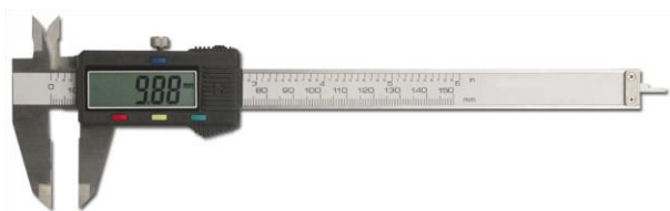
Рисунок 3 – Внешний вид штангенциркуля цифрового типа ШЦЦ-I-300

Плотность ( \rho ) в г/см 3 определяют по формуле (1). Результаты определения представлены в таблице 3.