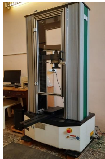
Рисунок 4 – Внешний вид универсальной испытательной машины MEITEISI WDW-50