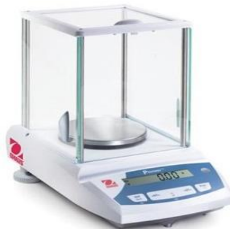
Рисунок 2 – Весы лабораторные Pioneer

Для определения плотности использовалась следующая аппаратура: весы лабораторные Pioneer (рис. 2) и штангенциркуль цифровой типа ШЦЦ-I-300 (рис. 3).