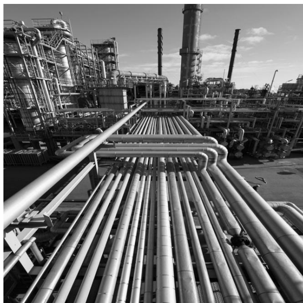
Рисунок 1 – Творческий мотив серии жаккардовых ковров «Индастриал»

Творческой инспирацией коллекции явились элементы стиля индастриал: мотивы города, промышленных объектов, кирпичной кладки, бетонных и металлических конструкций (рис. 1) – все, что является отличительной чертой любого мегаполиса. Индастриал – многогранное и неординарное стилистическое направление в дизайне. Стиль несколько суровый, однако притягивающий своим нетривиальным звучанием. Урбанистический пейзаж с фабричными трубами, арматурой, булыжными мостовыми и ретро-механизмами, затянутый производственной дымкой, смогом и туманом, – это картинка, положенная в основу оформления интерьера в таком стиле. По своей идее он объединяет в единое русло два взаимосвязанных течения жизни: прошлое и будущее. Старые, казалось бы, отжившие свой век предметы быта и детали превращаются в уникальные элементы декора. Этот самобытный ретро-футуристический стиль отождествляется с дымом и паром, будто бы скрывающим картину альтернативной реальности, – вот причина, повлиявшая на формирование основной палитры оттенков в индастриал-дизайне. Интерьер в урбанистической стилистике очерчен углем, сепией и графитом.