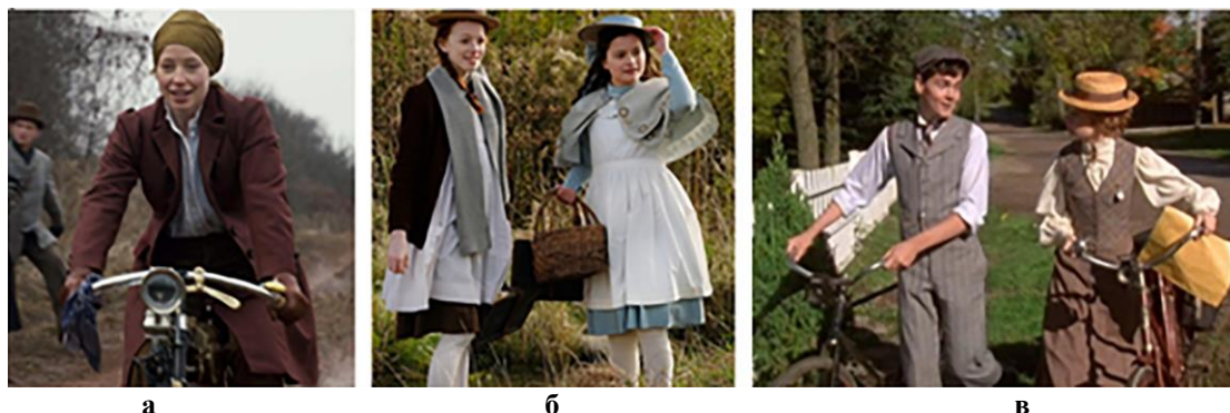
Рисунок 1 – Образы героев в экранизациях романа «Аня из Зелёных Мезонинов» : а) «прогрессивный» костюм велосипедистки в сериале «Энн» 2017 г. 1 ; б) провинциальные школьницы в сериале «Энн» 2017 г. 2 ; в) Энн и Гилберт на прогулке с велосипедами в сериале «Энн из Зеленых крыш» 1985 г. 3

проведен сравнительный анализ представленных в фильме вариантов костюма с реальной модой того времени.