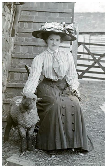
Рисунок 2 – Женская мода начала XX века 4

Изменились понятия о приемлемой активности для женщин, и в связи с этим появилась одежда для езды на велосипеде или игры в теннис. Традиционный и социально приемлемый силуэт юбки до щиколотки мог быть опасен для езды на велосипеде, поскольку юбка могла запутаться в спицах и цепи во время езды. Это привело к появлению такого изделия, как «юбка-брюки». Можно найти различные вариации «юбок-брюк», включая комплекты, где юбка имела кулиску по среднему шву переднего полотнища и шнуры, которые пролегли внутри, могли позволить поднимать юбки во время езды, чтобы сделать езду на велосипеде более безопасной. В этом случае под юбкой-трансформером носили широкие брюки.