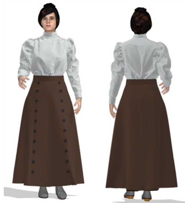
Рисунок 4 – Аватар с разработанным на него костюмом

Виртуальная примерка, безусловно, помогает проверить сложную конструкцию на аватаре, но тем не менее не избавляет от реальной примерки из материала, приближенного к прототипу. Апробация конструкции юбки-брюк на фигуре заказчика представлена на рисунке 5.