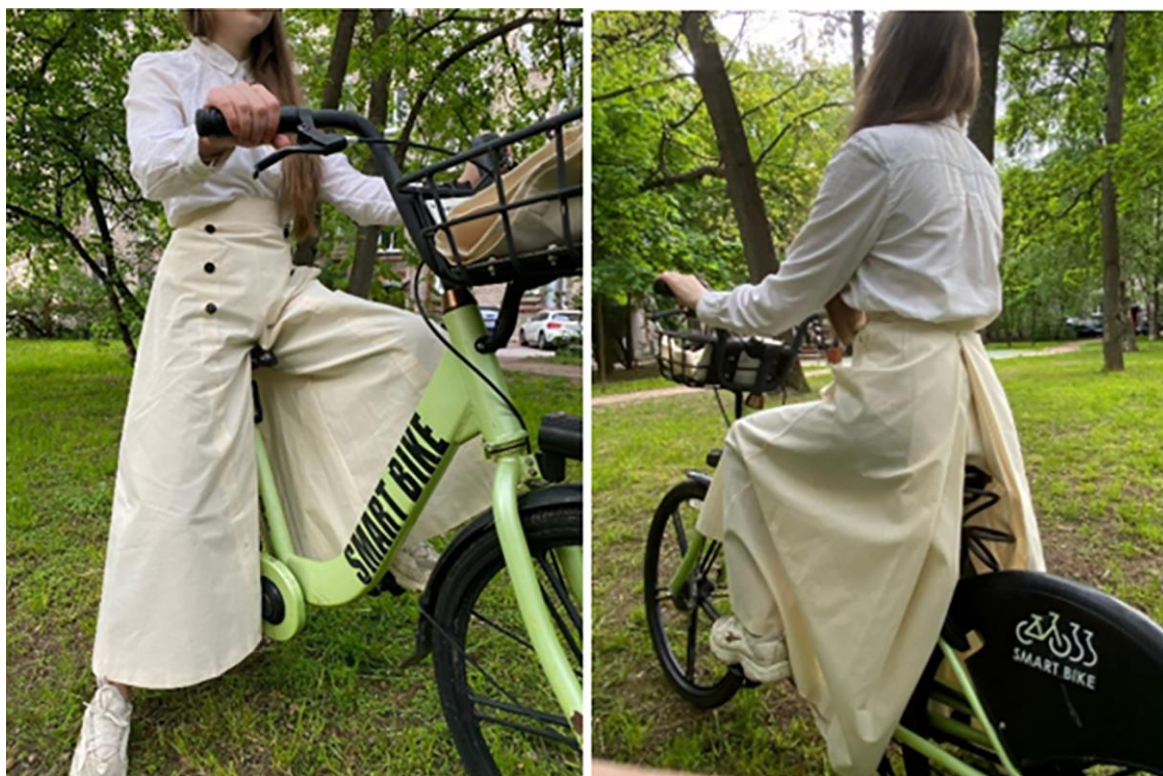
Рисунок 5 – Сценический образ героини спектакля

Таким образом, понимая и осознавая исторический аспект в создании образов сценического костюма необходимо грамотно подходить к подбору методов проектирования швейных изделий. Использование