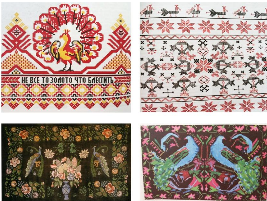
Рисунок 3 – Использование мотива павлина в белорусских орнаментах ручников и ковров

писи, ручниках, домотканых и рисованных коврах (рис. 3).