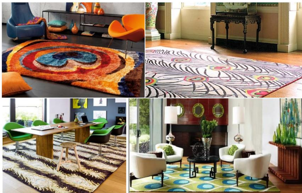
Рисунок 4 – Использование мотива перьев павлина в современном ковроткачестве

ет внесению новизны и сочетанию современности с традициями белорусского ткачества и мотивами стран народов мира (рис. 4).