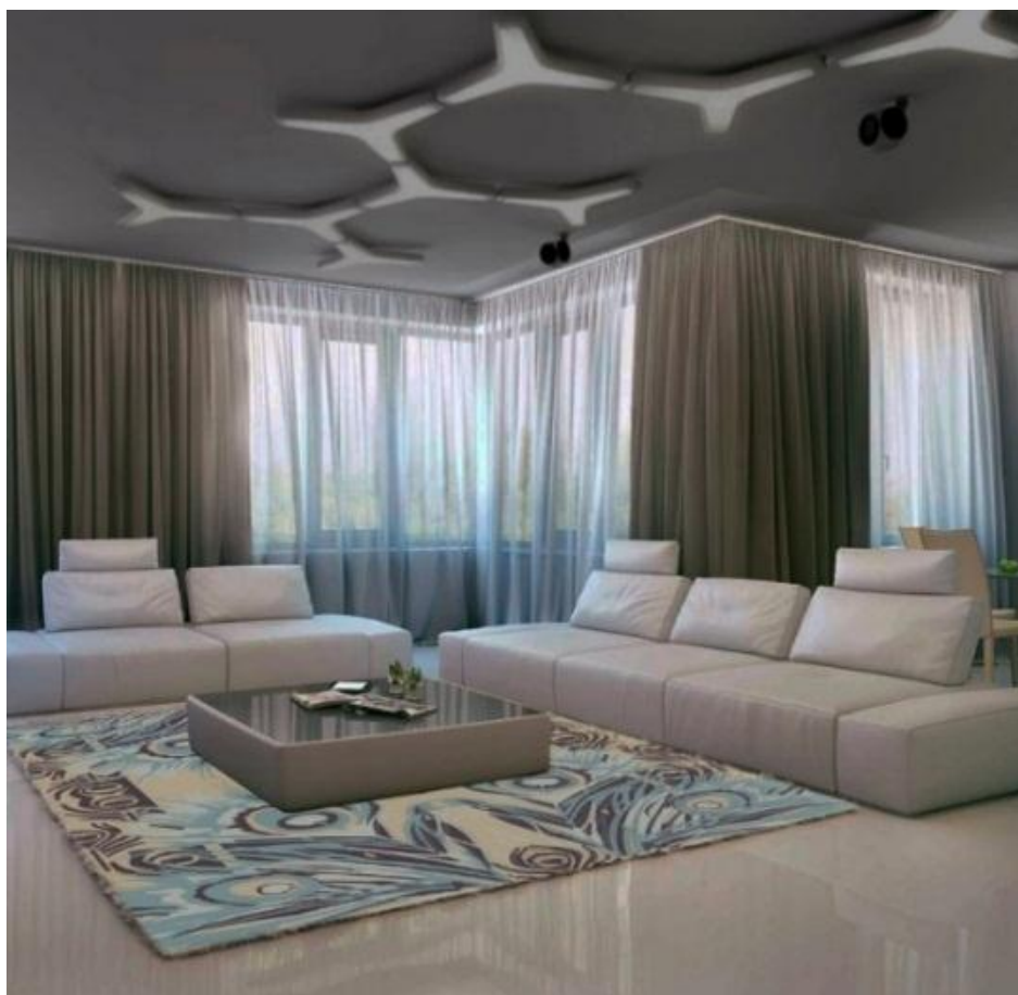
Рисунок 7 – Ковер в интерьере

Один из ковров коллекции в размере 2х3 м был выполнен на ОАО «Ковры Бреста». При этом использовались четыре цвета ворсовых нитей. Коренная основа верхнего и нижнего полотна – смешанная пряжа линейной плотности 31,7×2 текс, настилочная основа – смешанная пряжа линейной плотности 42×3 текс, ворсовая основа – нить полипропиленовая Heatseat линейной плотности 210 текс. Ткачество осуществлялось на двухполотном рапирном ковроткацком станке CRP-92 фирмы Wan de Wiele. Фактура, представленная ворсом в 9 мм, тесно связана с самим рисунком и подчеркивает его выразительность. Свойства нитей, использованных в ворсе, придают цвету изделия дополнительную глубину. Полипропиленовые нити имеют низкую стоимость, высокие антистатические свойства, податливость к термической обработке, стойкость к многим загрязнениям, не вызывают аллергические реакции и способны сохранять цвет в течение всего срока службы. Готовое изделие в интерьере представлено на рисунке 7.