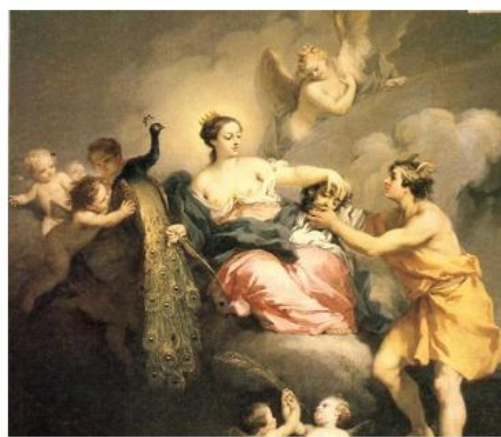
Рисунок 1 – Использование мотива павлина и жар-птицы в иллюстрациях к литературе разных стран мира

Изображения павлина, построенные с различной степенью стилизации, как близкой к реалистической, так и условной, можно встретить на монетах, мозаи-