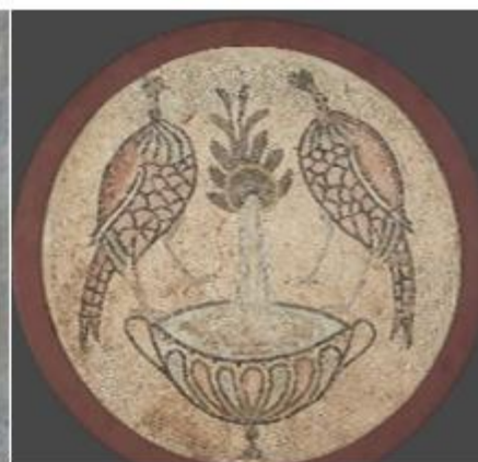
Рисунок 2 – Использование мотива павлина в скульптуре и мозаике различных стран мира