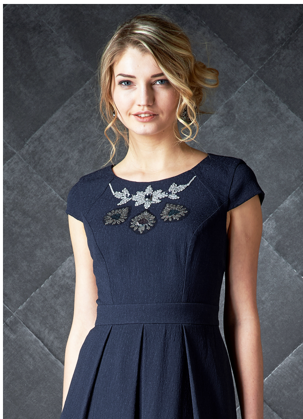
Рисунок 4 – Бестканевая вышивка на нарядном платье из коллекции бренда «ALEXANDER BOGDANOV»

Также особый интерес может вызвать бестканевая вышивка. Она создается на водорастворимой пленке и требует специального метода программирования, чтобы после удаления основы мотив сохранил форму. Вышивка без основы может быть, как съёмным декором, так и настрачиваться на изделие (рис. 4).