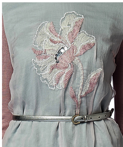
Рисунок 6 – Фрагмент вышивки на основной ткани изделия из коллекции бренда «ALEXANDER BOGDANOV»