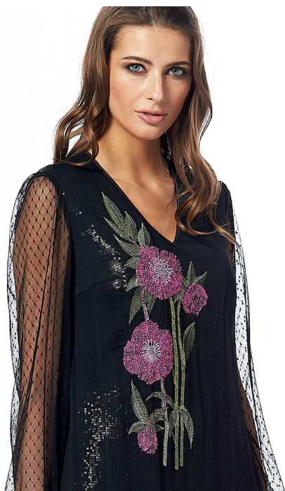
Рисунок 5 – Вышивка на основной ткани изделия из коллекции бренда «ALEXANDER BOGDANOV»