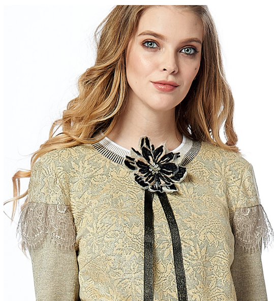
Рисунок 2 – Вышитая брошь из коллекции бренда «ALEXANDER BOGDANOV»

Немаловажную роль имеет принцип размещения декора в изделии. По принципу размещения на изделии декор делится на следующие типы: съемный декор (броши), аппликация и вышивка на материале изделия [5]. Броши чаще всего представляют собой декор, собранный из нескольких вышитых слов, или объемный декор, выполненный при помощи сложных техник пришивания таких материалов как шнуры, ленты, бисер, объемная текстурированная пряжа (по типу ровницы или букле), пайетки. Съемные аксессуары могут быть как самостоятельным изделием, так и входить в комплект к определенной ассортиментной единице в зависимости от дизайнерской задумки (рис. 2). Интересные решения вышитых брошей достигаются за счет грамотно подобранных материалов и техник исполнения. Такой декор соответствует романтическому стилю бренда и вносит большую привлекательность изделиям.