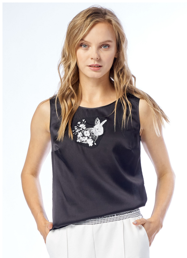
Рисунок 3 – Вышивка на сетке, настрочной (аппликативный) метод размещения.

Аппликативный декор чаще всего представляет собой шевроны либо вышивки, которые сложно разместить на основной ткани без использования стабилизатора. Преимущество настрочного декора заключается в возможности использования различных техник таких как кординг, пришивание пайеток, бисерной ленты, а также интересных интерпретаций глади и застилов без травмирования основной ткани во время шитья и напяливания материала. Шевроны чаще изготавливаются из плотной дублированной ткани и используются для верхнего ассортимента. В авторских коллекциях основной упор при проектировании такого декора делается на графическую и композиционно-смысловую составляющую [10]. При разработке настрочного декора на сетке используются сложные интерпретации застилов, разряженной плотности, контурные вышивки или вышивка текстурированными материалами (рис. 3).