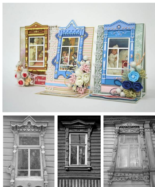
Рисунок 3 – Серия новогодних открыток «Сказочная Кострома». Автор: бакалавр 1 курса В. Москвина; рук.: доц. Ю.А. Костюкова, КГУ