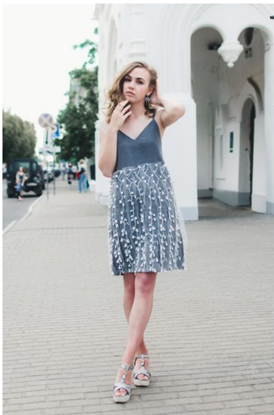
Рисунок 4 – Модель из коллекции «Снегурочка». Материалы: лен, шифон.