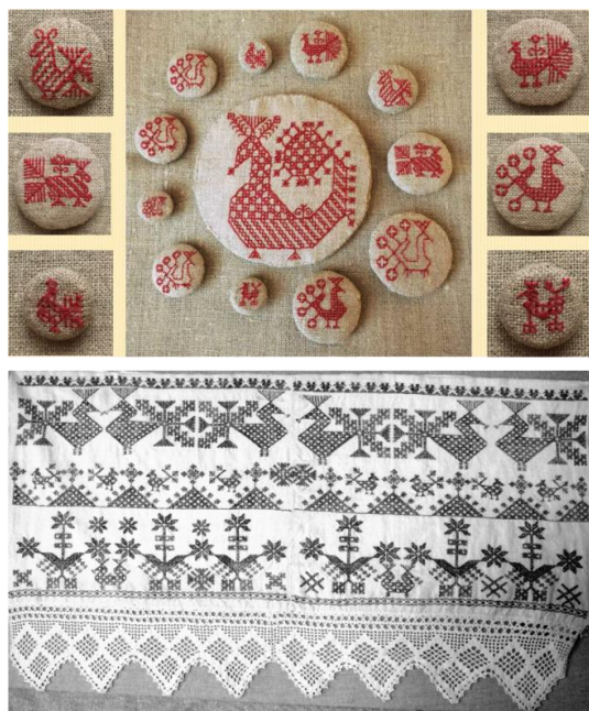
Рисунок 2 – Коллекция пуговиц «Берегиня». Автор: бакалавр 3 курса Ю. Короткова; рук.: педагог дополнительного образования М.В. Дубова, «Истоки»

Техника: прямое гобеленовое плетение. Материал: бисер, натуральная кожа, вискоза. Автор: бакалавр 3 курса Е. Запольская; рук.: доц. Е.Ю. Медведева, КГУ