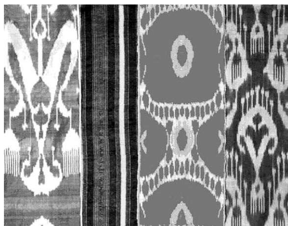
Рисунок 1 – Абровые ткани

Издавна родиной ткани хан-атласа, а также бекасама считаются узбекские города Маргилан и Наманган. В прошлом носить платья из хан-атласа имела право только высшая знать. Отсюда и название ткани – «хан-атлас». Особое место среди маргиланских хан-атласов занимают узоры с двумя