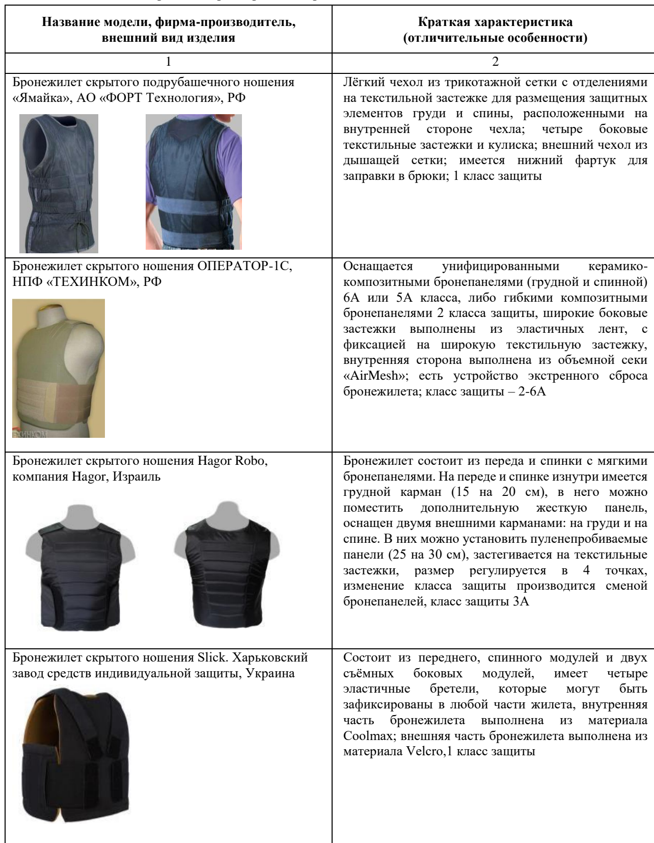
Таблица 1 – Виды и краткая характеристика бронежилетов

ведущих фирм как ближнего, так и дальнего зарубежья. Виды и краткая характеристика бронежилетов, выбранных для анализа, представлена в таблице 1.