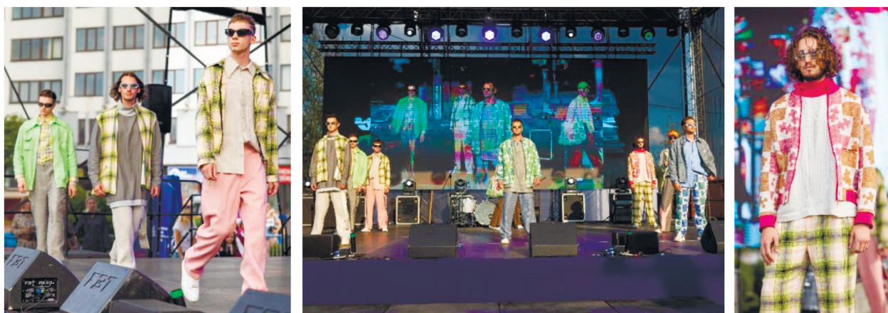
Рисунок 4 – Фрагмент коллекции «Альянс» бренда VSTU by Vitebsk State University of Technology

область) в июле 2023 года. По результатам фестиваля-конкурса авторская коллекция мужской одежды из льна для молодежи YOUNGSTERS стала победителем и награждена почетным знаком «Серебряный феникс» (рис. 4).