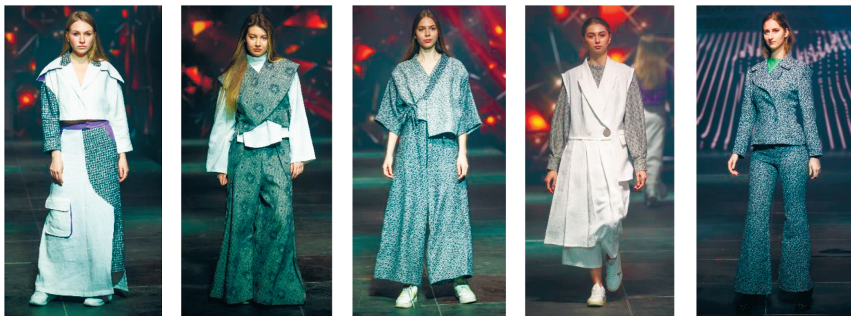
Рисунок 3 – Фрагмент коллекции «Альянс» бренда VSTU by Vitebsk State University of Technology

различного уровня. По результатам фестиваля студенты специальности «Дизайн костюма и тканей» награждены сертификатами «За развитие льняной отрасли и продвижение бренда «Белорусский лён» (рис. 3) [5].