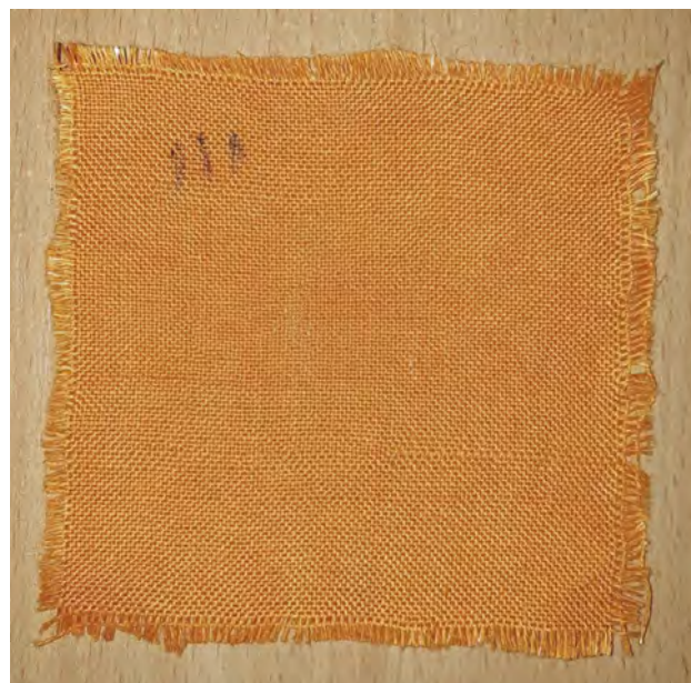
Рисунок 1 – Образец огнестермостойкой ткани

Нить, из которой изготовлена огнестойкая ткань, состоит из сердечника – стеклонити (содержание 15–30 %), покрытой огнестойкими синтетиче-