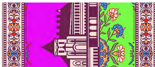
Рисунок 3 – Фрагмент технического рисунка с распределением отвлеченных цветов для обозначения различных модельных переплетений

В рисунке разработанного панно использовано шесть цветовых эффектов, что предполагает наличие в ткани шести систем уточных нитей. Каждый цвет создается своим видом переплетения, но в данном случае для двух одинаковых цветовых эффектов фона: серого и розового, – используется по два переплетения, одно из которых с короткими перекрытиями соответствует мелким элементам рисунка, другое – крупным. Последнее способствует формированию более чистого цвета, с одной стороны, а с другой, не искажает четкости прочтения рисунка наличием длинных уточных перекрытий. Поэтому технический рисунок, выполненный в программе Adobe Photoshop, размером 565x700 пикселей, имеет восемь отвлеченных цветов, дополнительными из которых являются фиолетовый и салатный (рис. 3).