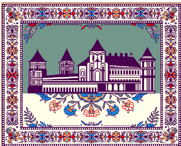
Рисунок 2 – Эскиз текстильного панно в одном из колоритов

именно под его руководство проводился третий этап строительства замка. В 1994 году замковый комплекс в Мире был причислен ЮНЕСКО к высшей категории памятников всемирной культуры [3]. Сегодня в «Замковом комплексе «Мир»» расположен музей, в котором одна из экспозиций, посвященная князьям Радзивиллам, демонстрирует и фрагменты слуцких поясов.