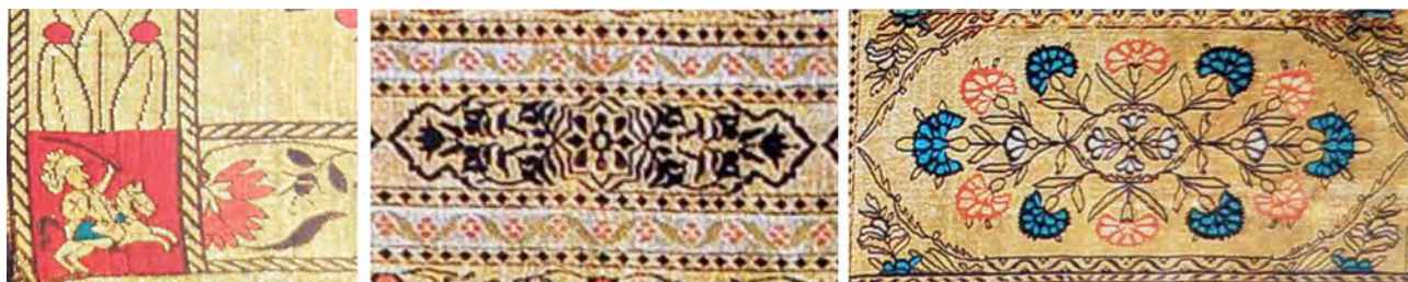
Рисунок 1 – Фрагменты орнамента аутентичных поясов слуцкого типа, используемых при разработке интерьерного панно

Мирский замок тесно связан с историей рода Радзивиллов, кроме того является важным объектом исторического наследия Республики Беларусь. Возведение замка началось в 20-е гг. XVI вв., когда владельцем земель являлся Юрий Ильичич. В 1566 замок в Мире перешел М.К. Радзивиллу, по прозвищу «Сиротка»,