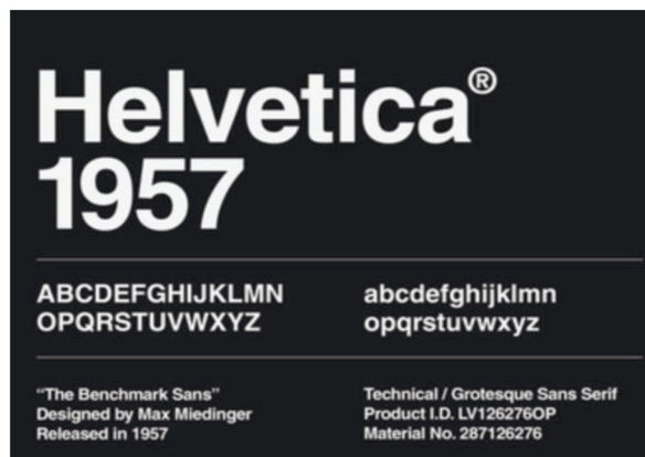
Рисунок 5 – Шрифт Helvetica

Шрифт был разработан так, чтобы не производить впечатление и не иметь никакого внутреннего значения. Благодаря этому его можно легко адаптировать к различным дизайн-проектам. Это одна из причин,