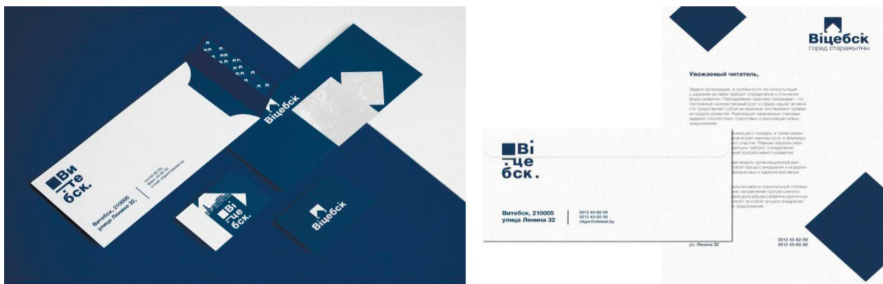
Рисунок 6 – Деловая документация

Также разработаны следующие элементы айдентики: деловая документация (бланк письма, конверт), листовки, сити-форматы, билборды, карта города и стикеры. Дизайн деловой документации для бренда Витебска сдержан и минималистичен. Конверт содержит логотип и графические элементы в виде стилизованного пантографа [8]. Помимо этого, на нем расположена нужная информация, такая как адрес, почтовый индекс, номера телефонов и e-mail (рис. 6).