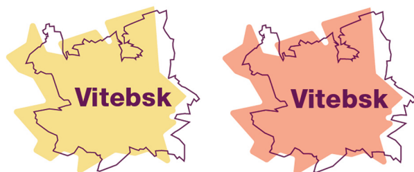
Рисунок 1 – Первый вариант логотипа

идея с очертаниями карты города. Контур заливается сплошной заливкой и на заднем плане создает контраст форм.