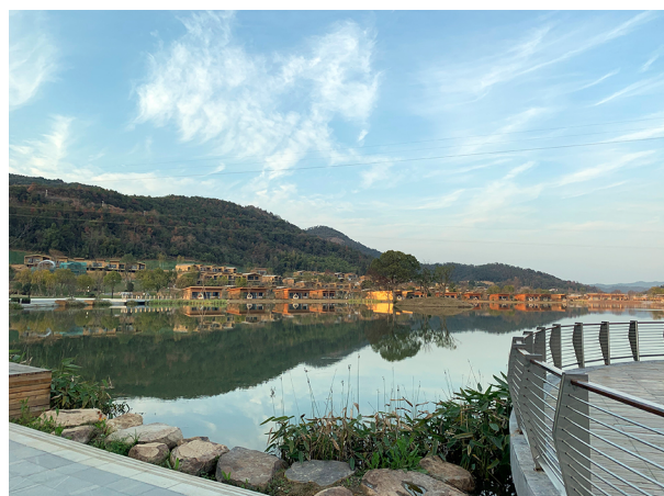
Рисунок 4 – Парковые зоны отеля

менные стили ландшафтного дизайна в Китае разнообразны, включая классическую красоту китайского сада, а также использование современных минималистичных и абстрактных направлений. Стремясь к модернизации, китайский ландшафтный дизайн уделяет внимание интеграции традиционных культурных элементов.