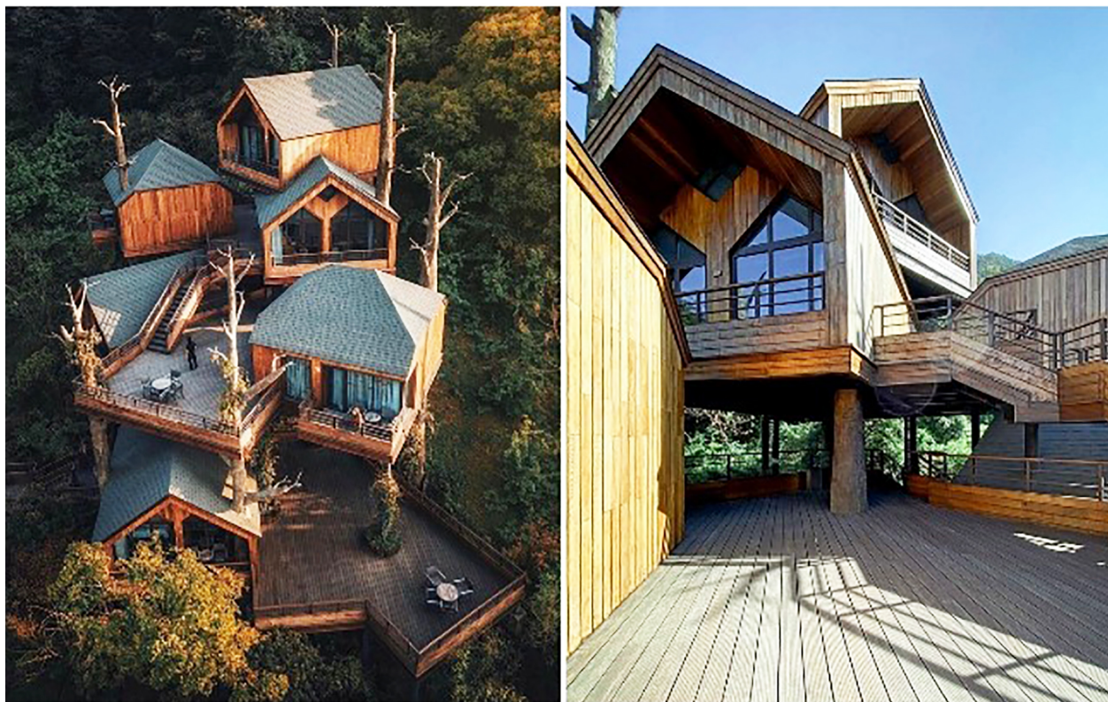
Рисунок 3 – Лоджии на деревьях

Компоновка деревянных сооружений потребовала разработки особой конструкции, состоящей из трех основных элементов: лестниц, платформ и деревянных хижин. Благодаря вертикальному размещению домиков под разными углами, извилистым переходам с подъемами и витиеватым лестницам на подходах