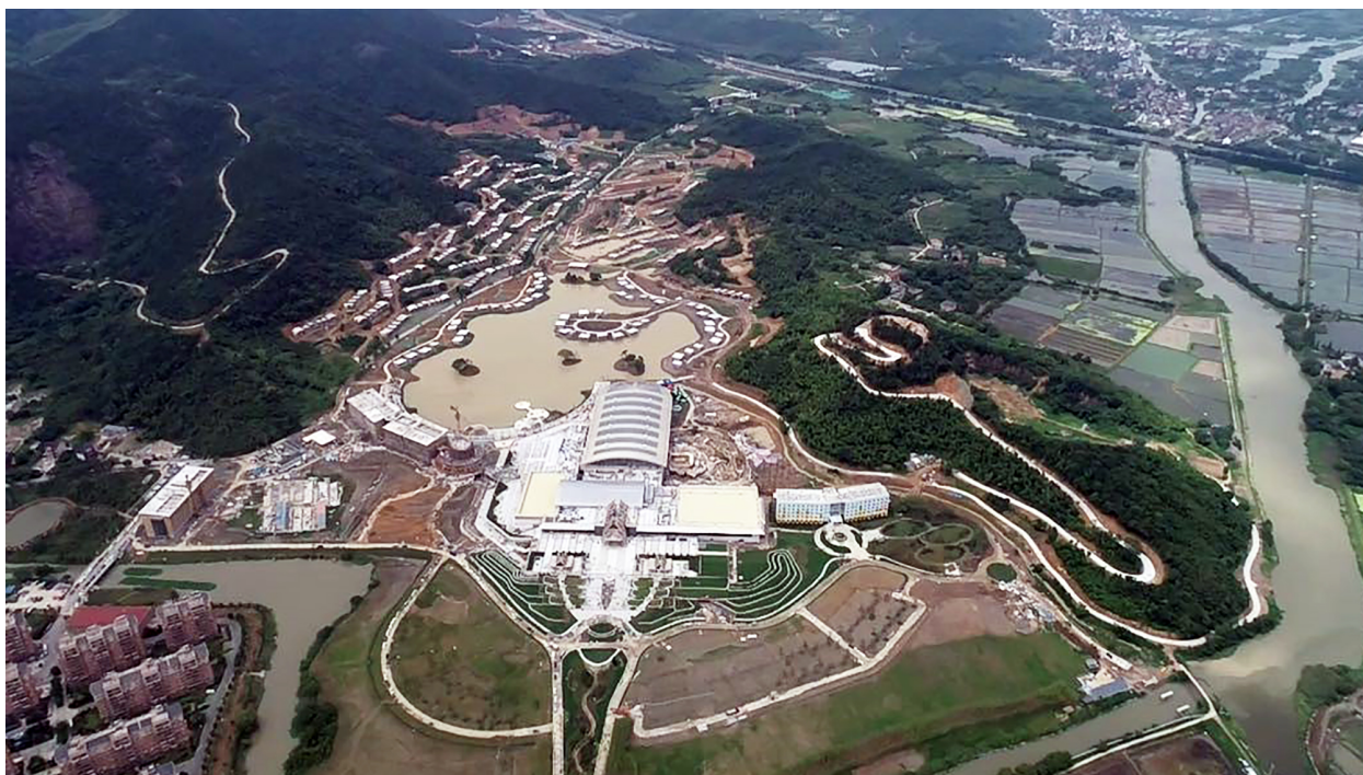
Рисунок 1 – Процесс строительства Moganshan Kaiyuan Senbo

Курортный спа-отель Moganshan Kaiyuan Senbo расположен в городе Хучжоу, провинция Чжэцзян, Китай. Этот мега-всепогодный, универсальный курорт имеет два основных направления: отдых и развлечения. Отель, занимающий площадь в 135 акров, включает в себя большой крытый аквапарк с подогревом, ряд детских площадок на открытом воздухе